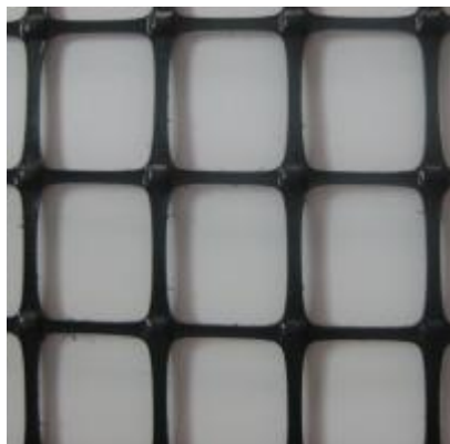
Д-40 Геосетка дорожная

Цвет: черный Размер рулона, м: 4x50, 2x50 Размер ячейки, мм: 40x40 На разрыв вдоль /поперек: не менее 16 кН