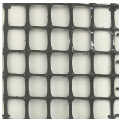
ЗР-20 Сетка для дорожек и парковок 20*20м 20м

Цвет: черный Размер рулона, м: 2x20 Размер ячейки, мм: 20x20