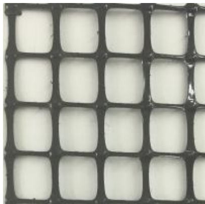
Д-33 Геосетка дорожная

Цвет: черный Размер рулона, м: 1,33x25, 2x25 На разрыв вдоль /поперек: не менее 16 кН