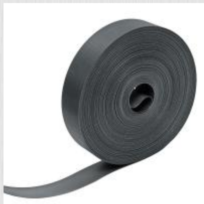
Лента для забора (3D, рабица) ЛЗ-48 0,048x50м графит

Материал: Полиэтилен Толщина: 0,7мм Диаметр рулона : 0,22м Температурный режим: -50 /+60 °С Вес: 1,4кг