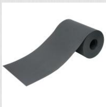
Лента для забора (3D, рабица) ЛЗ-190 0,19x25м графит

Материал: Полиэтилен Толщина: 0,7мм Диаметр рулона : 0,16м Температурный режим: -50 /+60 °С Вес: 2,8кг