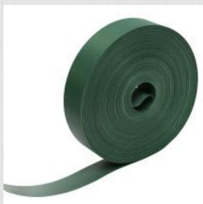
Лента для забора (3D, рабица) ЛЗ-48 0,048x50м хаки

Материал: Полиэтилен Толщина: 0,7мм Диаметр рулона : 0,22м Температурный режим: -50 /+60 °С Вес: 1,4кг