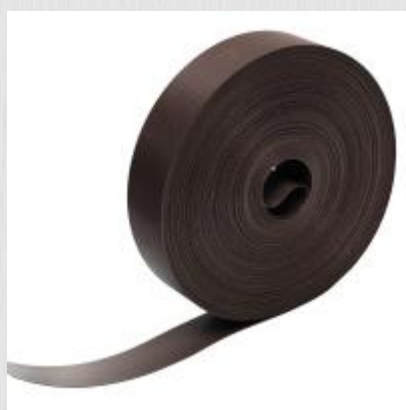
Лента для забора (3D, рабица) ЛЗ-48 0,048x50м коричневый

Материал: Полиэтилен Толщина: 0,7мм Диаметр рулона : 0,22м Температурный режим: -50 /+60 °С Вес: 1,4кг