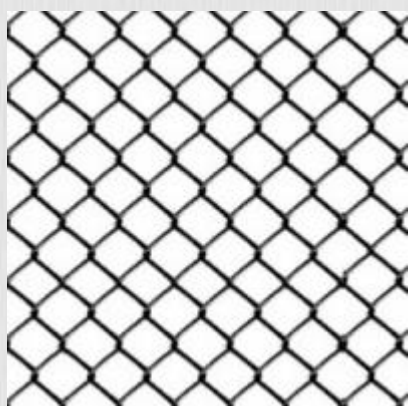
Сетка плетеная рабица 15x15мм d 1мм неоцинкованная

Размер рулона, м: 1x10 Размер ячейки, мм: 15x15 Вес м2/кг: 0,90