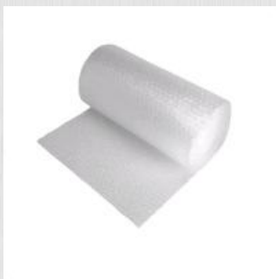
Пленка двухслойная воздушно-пузырчатая Basic

Тип пленки: двухслойная Плотность: 40мкм Размер пузырька: 10мм