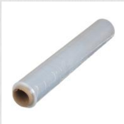
Стрейч-пленка 500ммx17мкм 1,1кг

Ширина: 450мм Толщина: 17мкм Вес: 1,1кг Коробка: 6шт