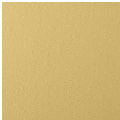
Стеклообои Рогожка Мелкая (потолочная) X-Glass Gold